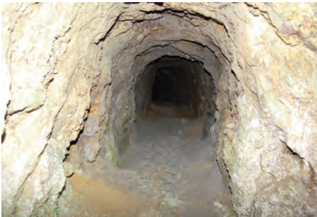
Interior de la galeria de la mina del mener de la Cort de Rossell.