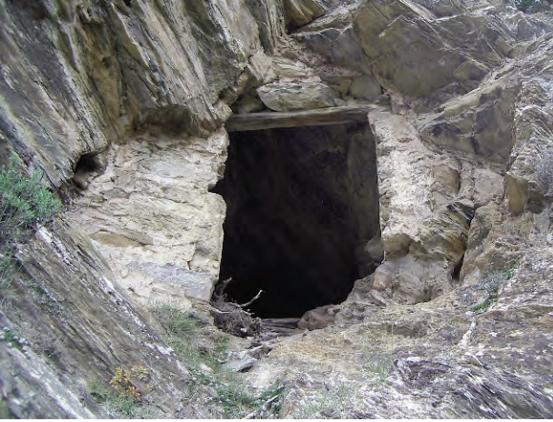
Cavitat natural situada a la muntanya de Rocafort que fou aprofitada com a polvorí durant els treballs de prospecció.