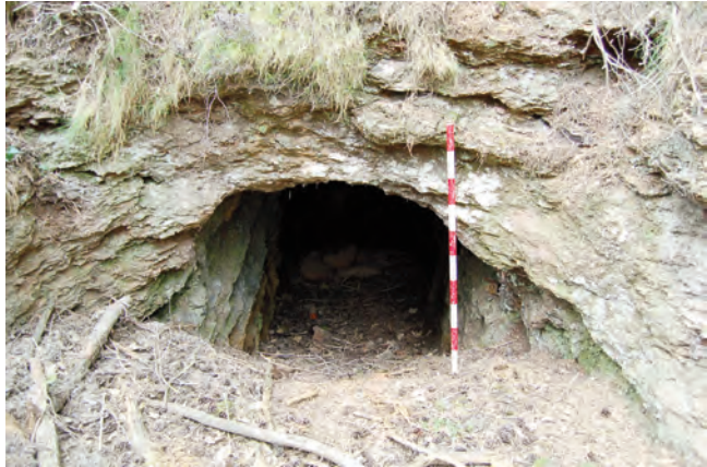
Boca de mina situada al bosc del Teix.