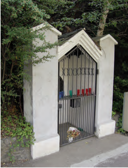
Oratori del pont d'Aixovall, darrere del qual s'amaga una de les mines obertes per la concessió Romanyà.