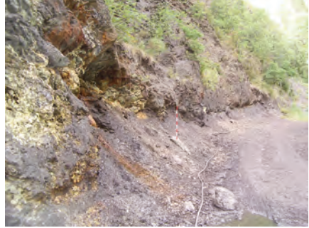
Traçat longitudinal de la galeria oberta prop del riu de Llumeneres i que ha quedat al descobert amb la recent construcció d'un vial.