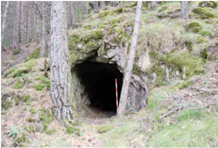
Boca d'entrada a la mina del mener de la Cort de Rossell.