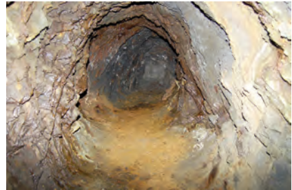
Extrem final de la galeria de la mina del mener de la Cort de Rossell, amb el front de talla tal com va quedar quan va ser abandonat.